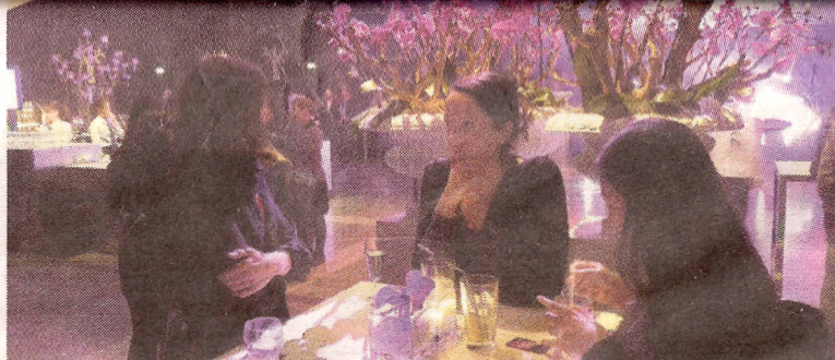
Gasten loungen in een feeëriek verlicht Beurs-WTC, klaar om te netwerken met zakenrelaties.

de netwerkfestijn is voor herhaling vastbaar. Waarom? De aankleding is toppie, de cocktails van prettig prijsniveau, de verantwoorde hapjes (zoals sushi, oesters en een breed scala fingerfood , zoals fruitpartjes en de gekste oriëntaalse specialiteitjes) smelten op de tong, en alle gesprekspartners blijken goedgemutst. En er is positief nieuws voor te diep doorzakkende drankorgels: ze kunnen spotgoedkoop huis-